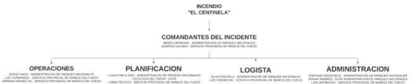
Diagrama del Comando de Incidente Unificado